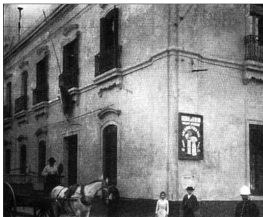
FIG. 5. Antiguo edificio de la Biblioteca Pública de Buenos Aires.